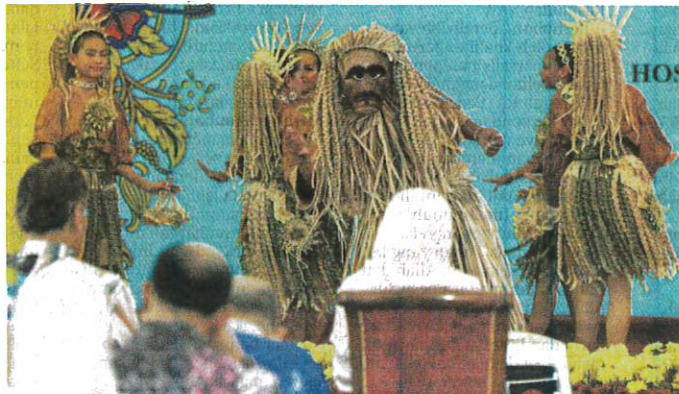
TARIAN Sidud iaitu tarian suku kaum Mah Meri oleh Kumpulan Main Jo'oh Tompoq Topoh dari Kampung Orang Asli Sungai Bumbun, Pulau Carey, Selangor dipersembahkan kepada Raja Permaisuri Agong yang berkenan melawat HOAG, semalam.

"Ini pasti memerlukan kerjasama semua pihak, sama ada kerajaan, swasta atau sektor ketiga, selari dengan pendekatan seluruh negara ( whole-of-nation approach ) yang menjadi teras Agenda Nasional Malaysia Sihat," katanya.