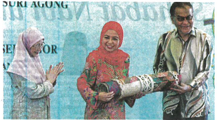
RAJA Zarith Sofiah diiringi Dr Wan Azizah (kiri) berkenan menerima cenderahati daripada Dr Dzulkefly ketika melawat HOAG, semalam.

Seri Paduka Baginda kemudian berkenan meluangkan masa setengah jam melawat pesakit di wad HOAG sebelum berangkat pulang.