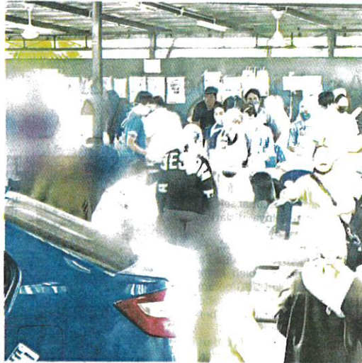
SEBAHAGIAN murid dibawa ke Hospital Wanita dan Kanak-kanak Sabah, Likas bagi mendapatkan rawatan semalam.

Mengulas lanjut, Raisin memaklumkan setakat ini, punca keracunan makanan masih disiasat dan belum dapat dipuktuskan sama ada daripada makanan di kantin sekolah atau RMT.